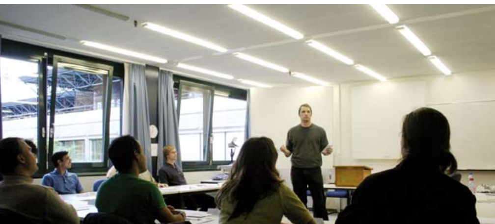
S'exercer à captiver un auditoire!

thousiasmé, il s'inscrit au club et présente peu après un exposé sur son pays, la Suède. Ce premier discours, c'est l' ice breaker dans le jargon des TM (Toastmasters). C'est la première étape du parcours – qui en compte 10 – qui mène au titre de Competent Communicator . Un Competent Communicator qui suit un second parcours, le leadership track , obtient le titre de DTM, Distinguished Toastmaster . C'est au candidat de choisir jusqu'où il veut aller. Rien n'est obligatoire. S'il se sent doué, il peut même affronter des collègues d'autres clubs et d'autres pays lors de compétitions régionales.